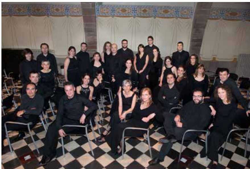
📍 Cor de Cambra de Granollers.

Volem comptar amb tots vosaltres per compartir una vetllada especial i emotiva que de ben segur gaudirem en companyia de tots els socis de l'entitat.