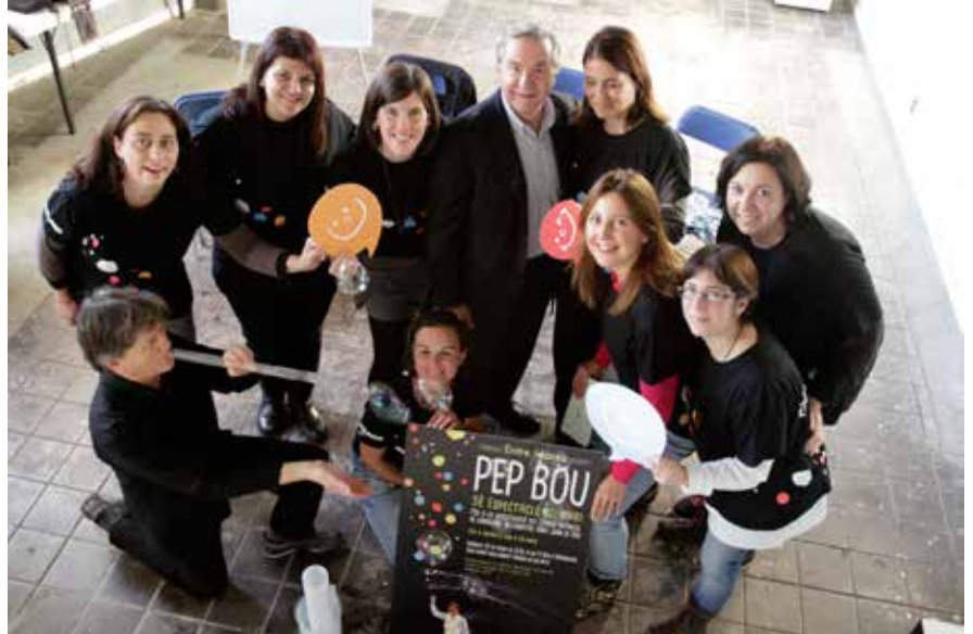
Entre mares.

El cinquè espectacle solidari per a infants fins a 99 anys és obert a la participació de tothom, l'entrada donatiu té un cost, anticipat de 8€ per a infants de 3 a 10 anys, i a partir d'11 anys l'entrada val 12€. De 0 a 2 anys és gratuït i el dia de l'espectacle l'entrada té un preu únic de 14€.