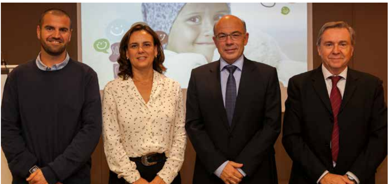
1 Presentació Somriures que curen.

LA SOLIDARITAT EXTERNA és la que revertim a la societat que ens envolta. La Mútua va néixer i s'ha desenvolupat gràcies a la voluntat i la força de la societat civil i, en conseqüència, part dels seus beneficis els vol retornar a la societat, en forma de col·laboracions molt diverses o participant en projectes de caràcter solidari i humanitari.