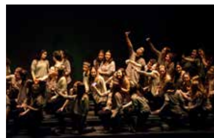
📍 Cor infantil Amics de la Unió.