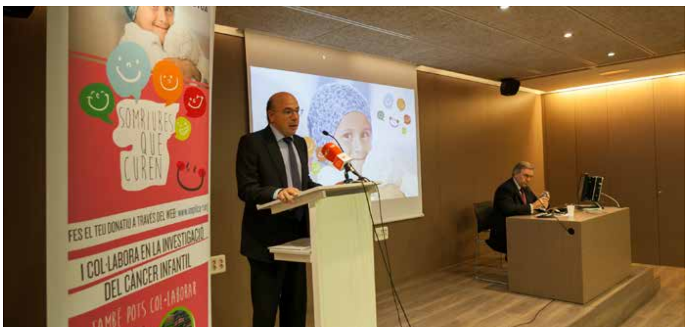
Presentació Somriures que curen.