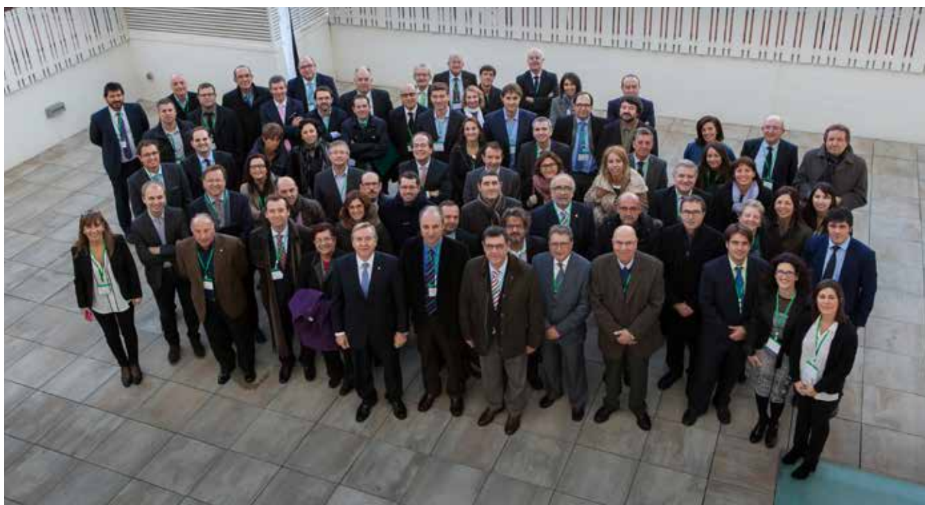
Tots els assistents de les II Trobades a la terrassa del Cemav.