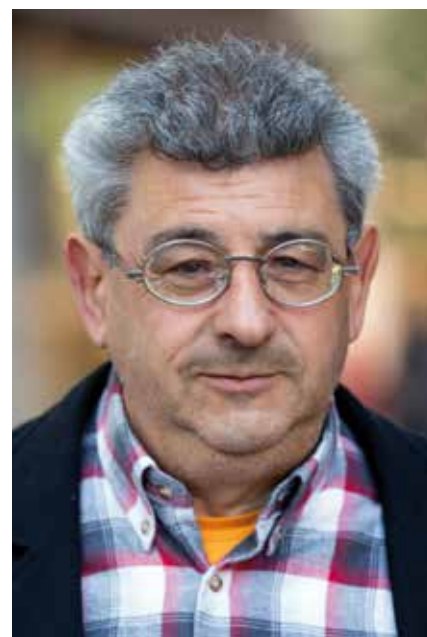
📍 Primera seu del carrer Anselm Clavé l'any de la nevada (1962).