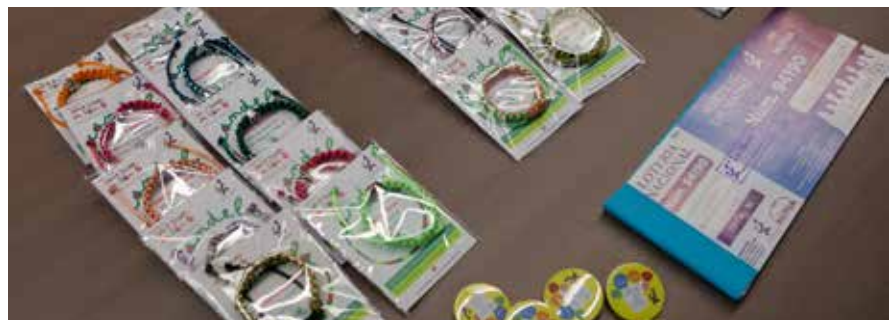
Polseres Candela i Participacions del Sorteig de Nadal.